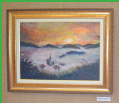
Sončni zahod, pokrajina – avtor Birman Shrestha (iz Nepala, živi v Preboldu)