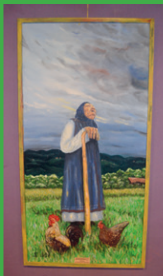
Starka – avtorica Živka Vihtelič Vodlan, nagrada GRAND PRIX