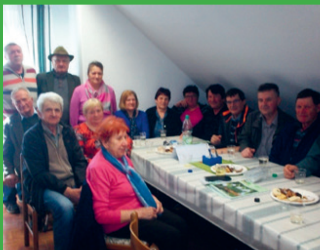
1, konstitutivna seja UO, NO, ČR DU Žetale, 7.4.2018