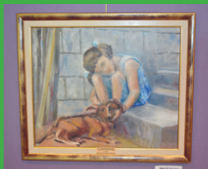
Deklica s psom – avtorica Rozina Šebetič, najstarejša udeleženka dogodka (udeležila se je skoraj vseh prireditev ex tempore)