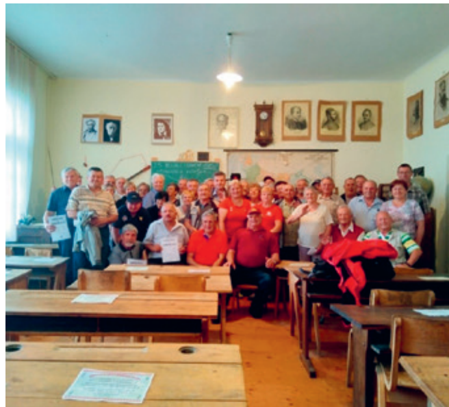
Gasilski veterani GZ Videm v učnici OŠ Brihtna glava v Radovici pri Metliki