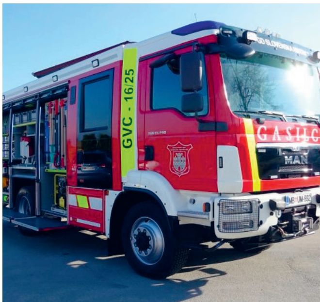
Gasilsko vozilo s cisterno GVC 16/25

Upravni odbor PGD Žetale je na svoji seji soglasno sprejel sklep o nabavi novega gasilskega vozila s cisterno GVC 16/25. Navedeno vozilo bo zamenjalo obstoječe orodno vozilo IVECO, ki je letos staro 18 let. Terminski plan nabave vozila predvideva nabavo vozila v obdobju 2018-2022 in slovesno predajo vozila leta 2023 ob praznovanju 70. obletnice PGD Žetale. Osnovne karakteristike: vozilo ima vgrajen rezervoar volumna med 2000 in 3000 l vode, gasilsko-tehnično opremo ter najmanj eno hitronapadalno napravo. Vozilo ima vgrajeno gasilsko centrifugalno črpalko, gnano preko motorja vozila. Posadka vozila je zmanjšan oddelek 1+5 ali oddelek 1+8. Gasilsko vozilo s cisterno GVC 16/25 se uporablja za gašenje in reševanje pri požarih ter za manjše tehnične intervencije. Prednosti vozila so večja količina vode v rezervoarju in možnost izvedbe hitrega napada. Dejanska cena nabave vozila bo znana, ko izveden postopek javnega razpisa. Po informacijah, ki smo jih do sedaj pridobili, znaša informativna cena gasilskega vozila s cisterno GVC 16/25 240.000 EUR.