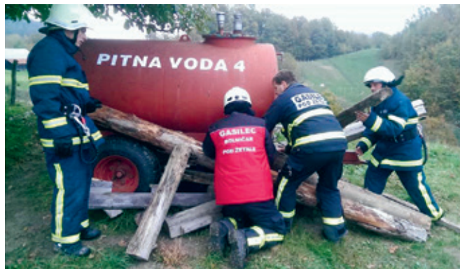
Vaja operativnih članov PGD Žetale

Pridobljeno znanje na tečajih in usposabljanjih je potrebno nenehno obnavljati, čemur služijo gasilske vaje, ki potekajo enkrat mesečno oz. po potrebi.