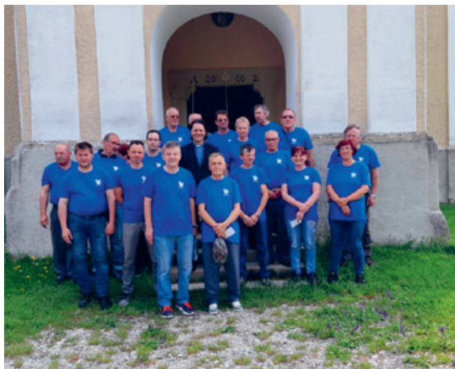
Gasilski veterani PGD Žetale in PGD Pekre pred romarsko cerkvijo Marije Tolažnice