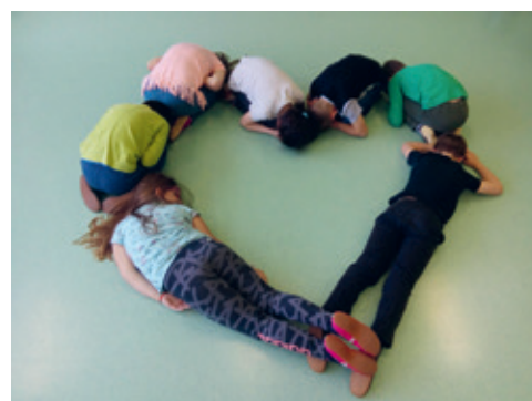
Tako so učenci 3. razreda kar s svojimi telesi ustvarjali mandale.